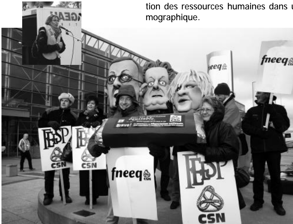
Manifestation au congrès de la Fédération des cégeps le 21 octobre 2004, à Québec

tion des ressources humaines dans un contexte d'une baisse démographique.