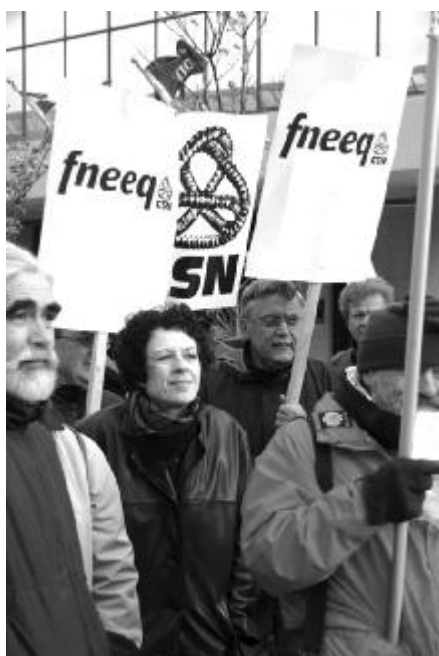
Manifestation au congrès de la Fédération des cégeps le 21 octobre 2004

En résumé, donc, les relations entre les directions des collèges et la Fédération des cégeps sont dans l'ensemble excellentes ou très bonnes, ou alors relèvent d'une soumission résignée. La décentralisation apparaît, pour plusieurs, la solution à des problèmes qui restent mal définis et qu'on refuse obstinément de relever dans les systèmes collégiaux voisins, où ils sont parfois pires.