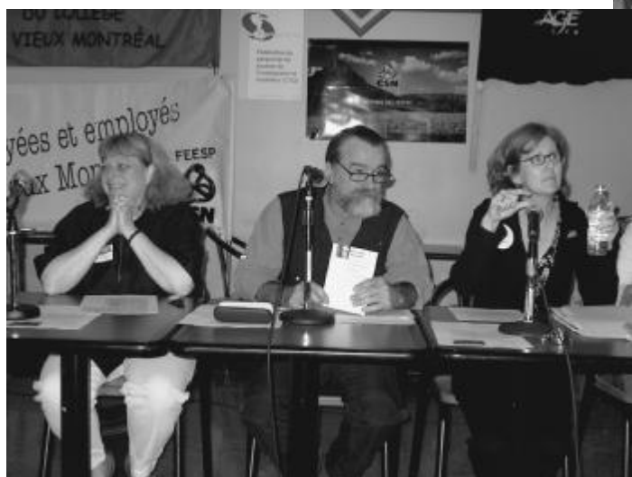
Assemblée intersyndicale au Vieux Montréal le 29 septembre 2004