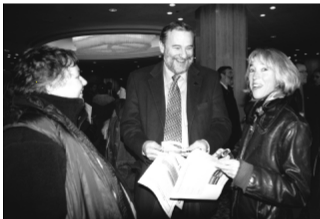
Manifestation au congrès de la Fédération des cégeps le 21 octobre 2004.

Si, par exemple, les enseignantes et les enseignants de la formation générale sont plus inquiets et, partant, peut-être plus mobilisés, ce n'est pas le cas partout. Si dans plusieurs syndicats, le secteur technique est plus ouvert au discours de l'autonomie (on parle parfois d'une nostalgie des écoles techniques), on dira ailleurs que ces départements ont un regard très critique sur les projets du gouvernement.