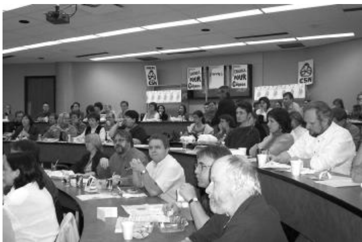
Assemblée intersyndicale à Sherbrooke le 18 novembre 2004

Dans le même ordre d'idées, on signale la nécessité que les actions que l'on propose soient ciblées et bien concrètes. À plusieurs endroits, les « petites » actions sont décrites comme dépassées.