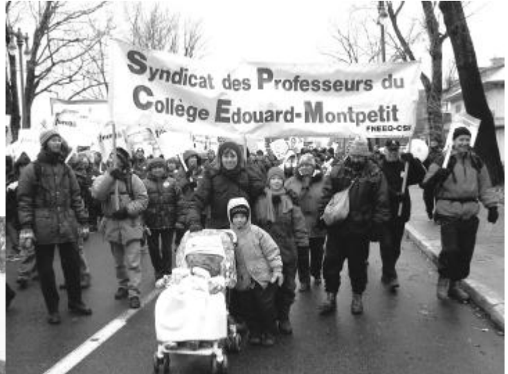
Grande manifestation de la CSN le 29 novembre 2003 à Québec