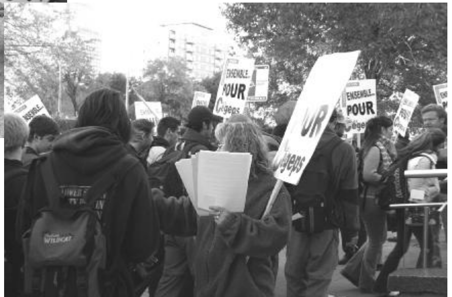
Manifestation et distribution de tracts au cégep du Vieux Montréal le 5 octobre 2004