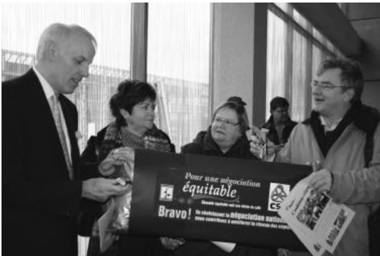
Manifestation au congrès de la Fédération des cégeps le 21 octobre 2004 à Québec

De manière générale, les hautes directions de l'ensemble des collèges (les DG et les DÉ) semblent assez unanimes et ne parlent que d'une seule voix. Elles adhèrent au discours de la Fédération des cégeps et à ses orientations. Elles sont favorables à la décentralisation du réseau collégial, la négociation locale et l'habilitation, c'est-à-dire la possibilité de décerner le diplôme. Certaines vont même plus loin. Elles voudraient décerner leur propre diplôme. Elles en rêvent.