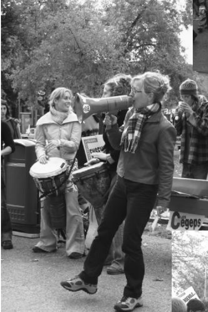
Manifestation au cégep Saint-Laurent le 5 octobre 2004, à l'occasion de la Journée mondiale des enseignantes et des enseignants